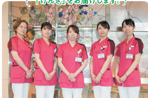
仙台オープン病院栄養管理室の皆さん (同病院については6・12P)