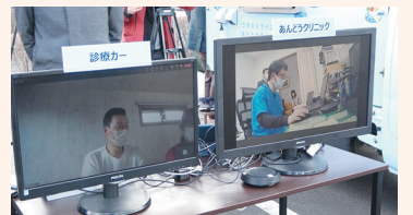
2月22日に行われた公開実証の様子