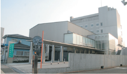
仙台市若林区舟丁にある仙台市急患センター・仙台市医師会館