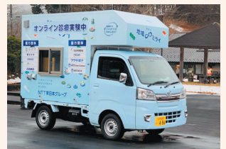
軽トラックを改造した診療カー

山間地などを想定した実験でしたが、診療カーの看護師からは「街中の在宅患者さんにこそ必要な方法かもしれない」との感想がありました。それは実験の方向性を変えるような重要な指摘でした。